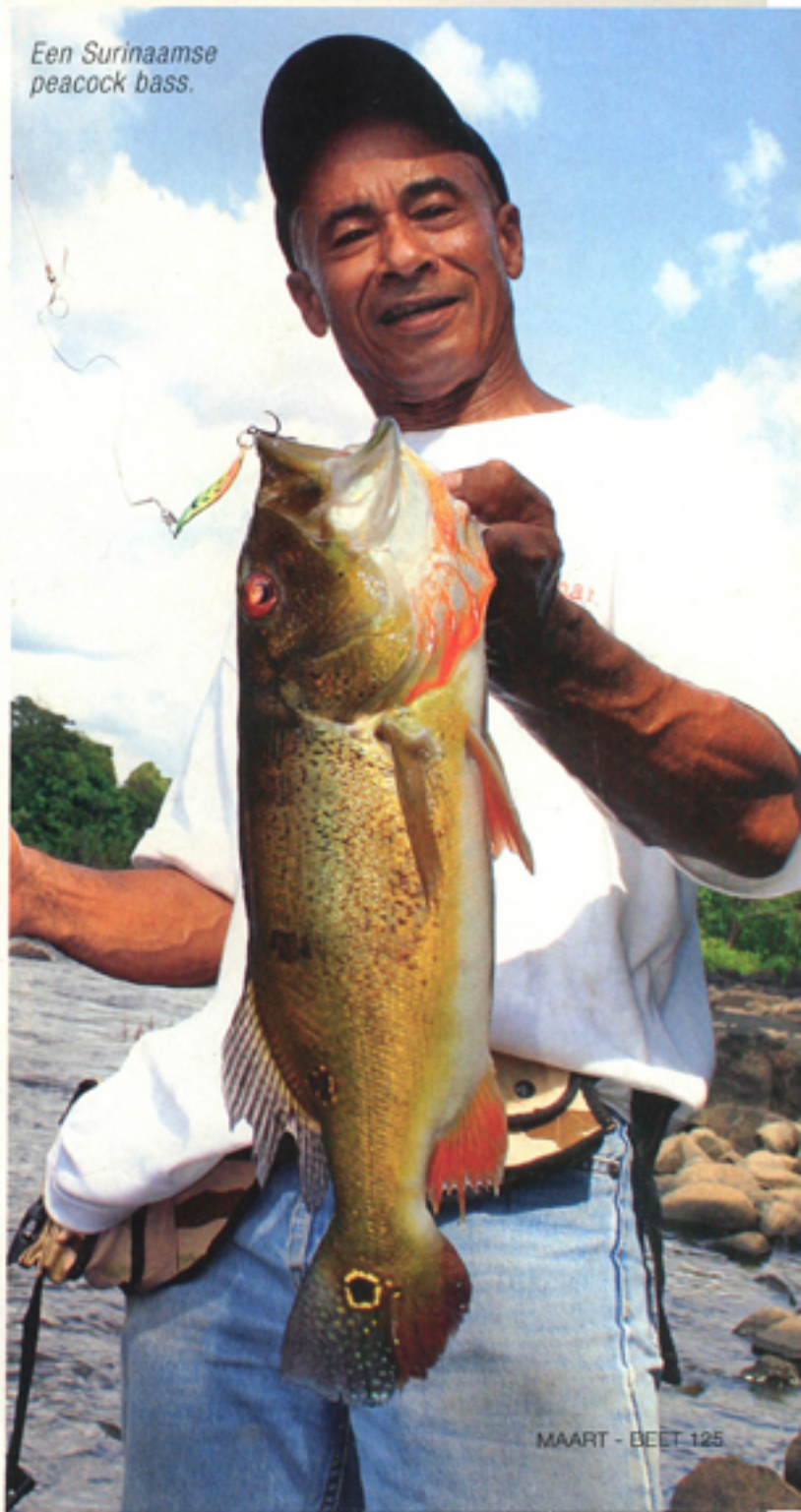
Een Surinaamse peacock bass.