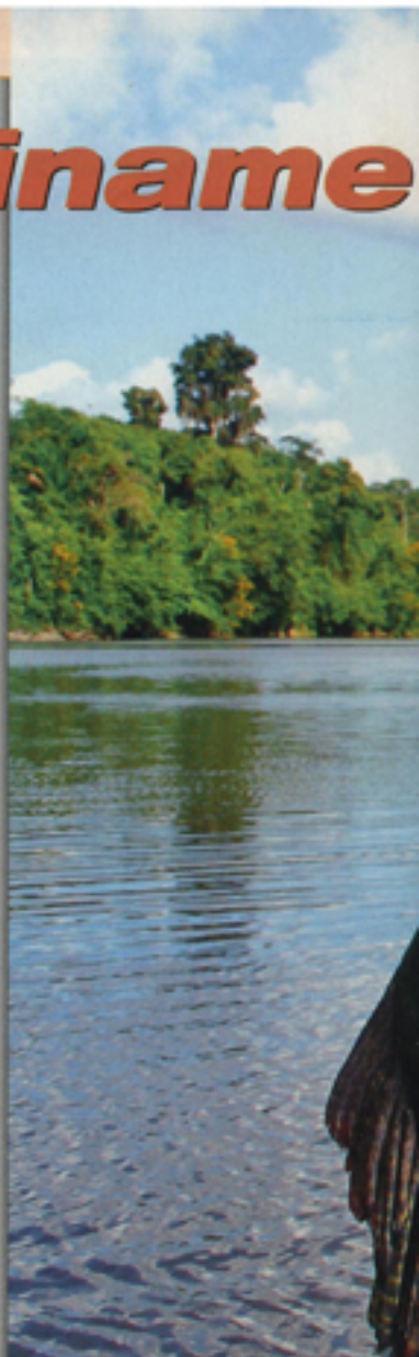
Het is onvoorstelbaar hoe sterk Karel Dawson 'in full action' op